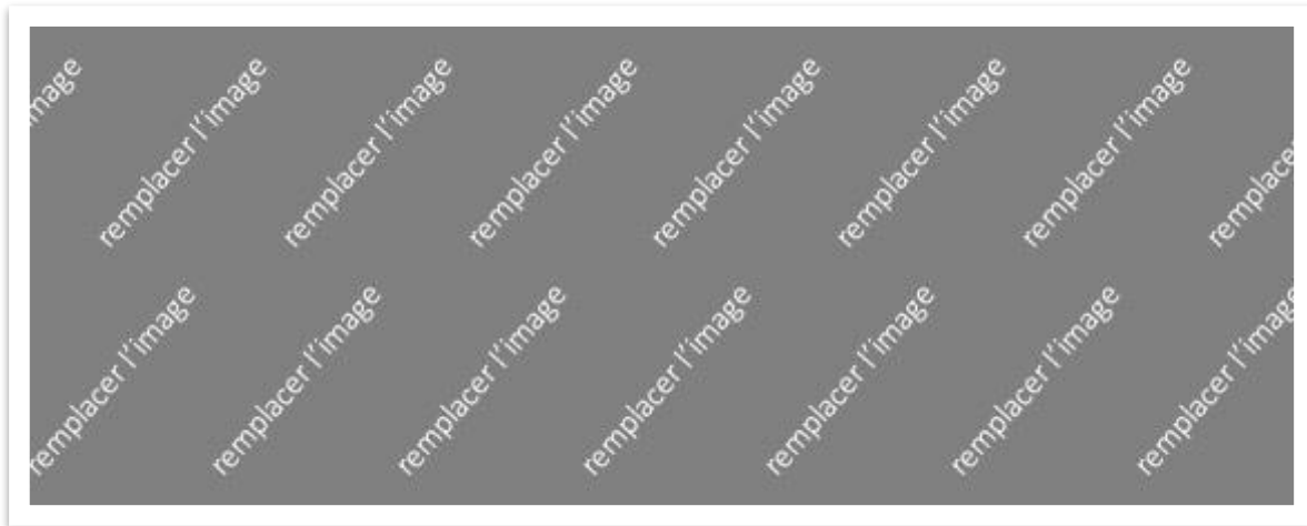
Style d'image : bordure blanche, ombre portée

Lorem ipsum dolor sit amet, consectetur adipiscing elit. Mauris id ante nec orci vehicula faucibus vel sed tortor. Phasellus venenatis, est sed varius euismod, ligula ex malesuada quam, quis pretium ante tortor eu ipsum. Nam auctor purus ut ex vehicula feugiat. Integer consequat eros non dui lobortis finibus. Nunc in congue erat. Quisque blandit in justo id sollicitudin. Pellentesque ut convallis sem, sit amet rutrum lectus.