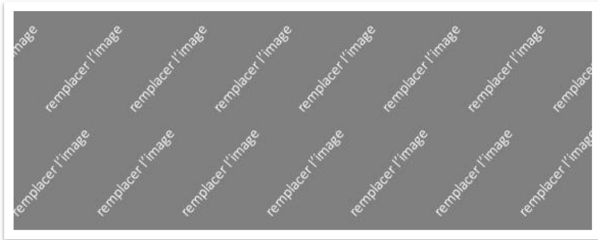
Style d'image : bordure blanche, ombre portée

Lorem ipsum dolor sit amet, consectetur adipiscing elit. Mauris id ante nec orci vehicula faucibus vel sed tortor. Phasellus venenatis, est sed varius euismod, ligula ex malesuada quam, quis pretium ante tortor eu ipsum. Nam auctor purus ut ex vehicula feugiat. Integer consequat eros non dui lobortis finibus. Nunc in congue erat. Quisque blandit in justo id sollicitudin. Pellentesque ut convallis sem, sit amet rutrum lectus.